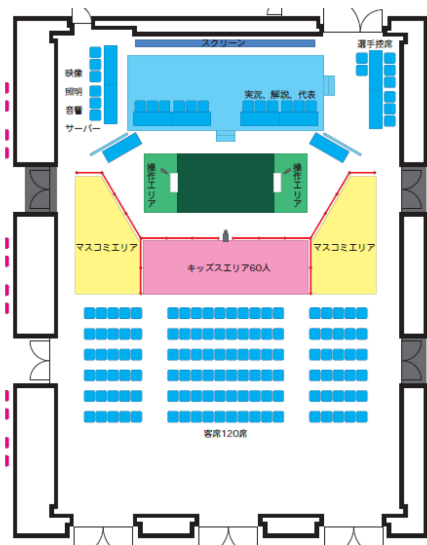
パナソニックセンター東京 1F ホール

下記図面の黄色に着色した「マスコミエリア」がフィールド撮影の場合に取材可能なエリアとなります。 選手控室の位置は当日お配りするプレス用資料をご覧ください。 撮影に関する詳細な指示は当日スタッフからご説明させていただきます。